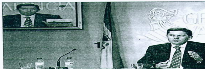
RUEDA DE PRENSA. Rambla tras la reunión del Consell.

■ Se harán contratos individuales con un plazo de ejecución de 15 años